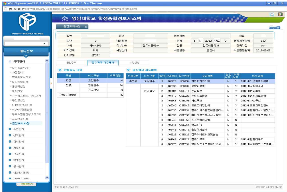
[그림 4-2] 졸업모의사정 필수과목 이수내역 화면