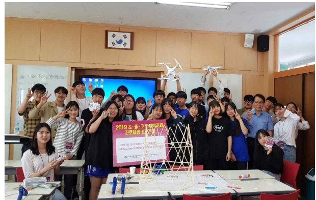
초·중·고 자유학기제 대학생 교사 활동