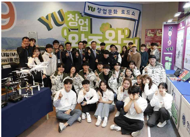
YU 창업문화로드쇼 총장님과 함께 ~