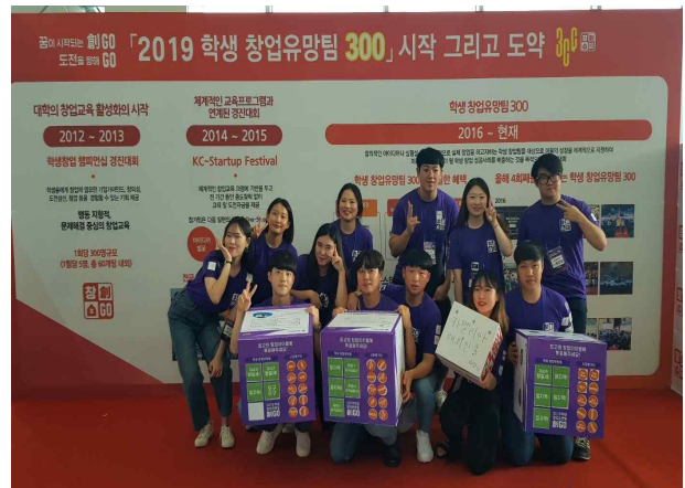
교육부 학생창업유망팀 300 본선 참가팀