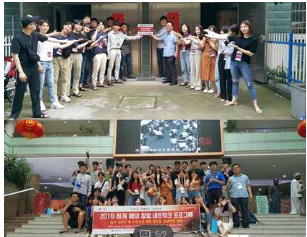
글로벌시장 해외 현지사무소 개소