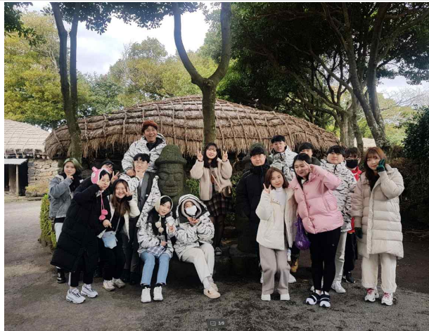
동아리 역량강화 워크숍 (제주도)