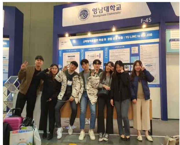
전국 대학교 산학협력엑스포 아이디어 전시회