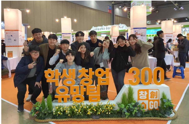
교육부 학생창업유망팀 300 부처통합 본선 진출